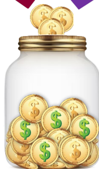
CUENTA DEL CLÉRIGO